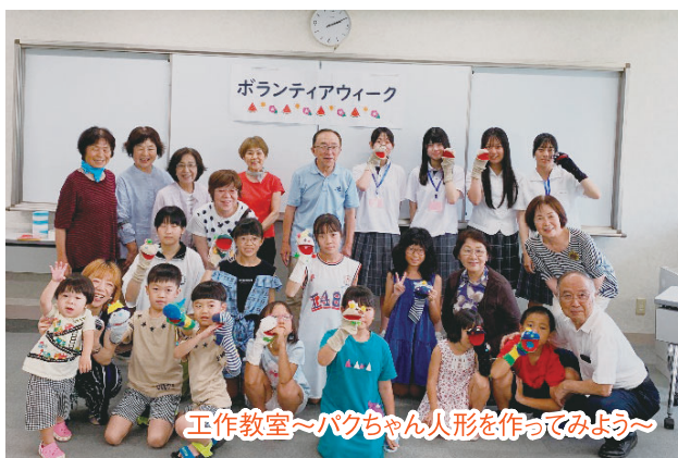
工作教室～バクちゃん人形を作ってみよう～