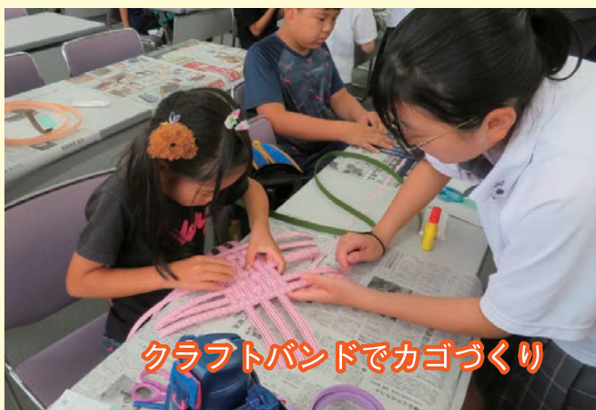
クラフトバンドでカゴづくり