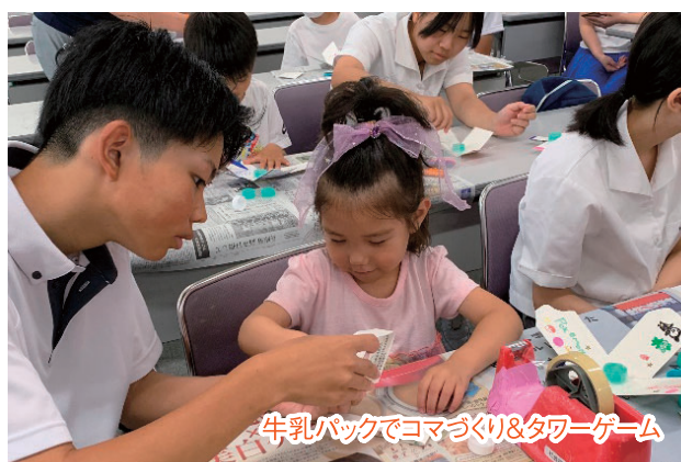
牛乳パックでコマづくり&タワーゲーム