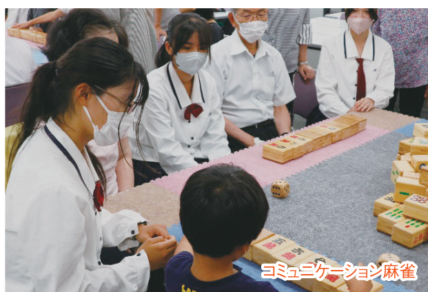
コミュニケーション麻雀