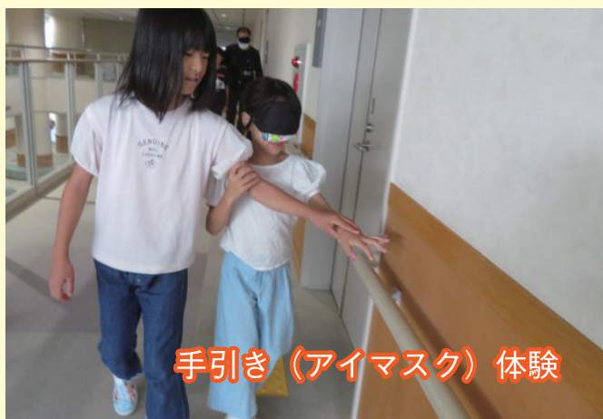
手引き（アイマスク）体験