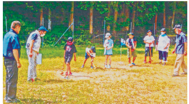
上若井町ふれあい交流会