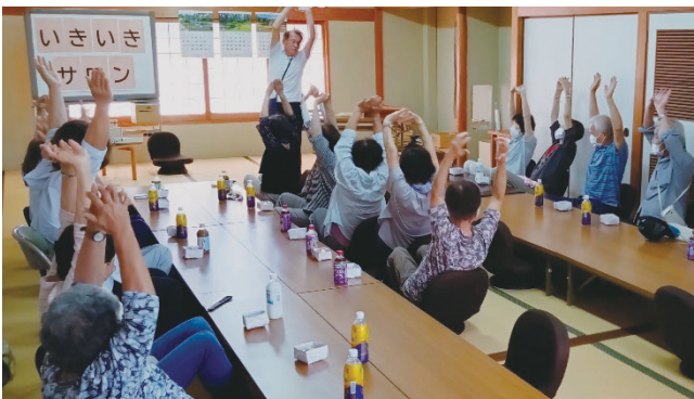
田原町ふれあいいきいきサロン

昨年度、皆さまから寄せられた共同募金は、総額7,535,696円でした。このうち県共同募金会から加西市共同募金委員会へ7,022,000円の配分があり、加西のまちを良くするために次のような活動に活かされています。また、災害時の被災地支援にも役立てられています。