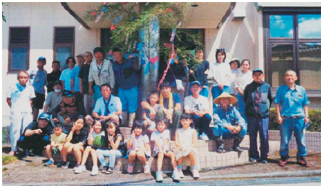
西上野町ふれあい七夕まつり