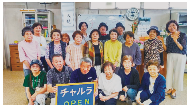
古坂1丁目ふれあいいきいきサロン