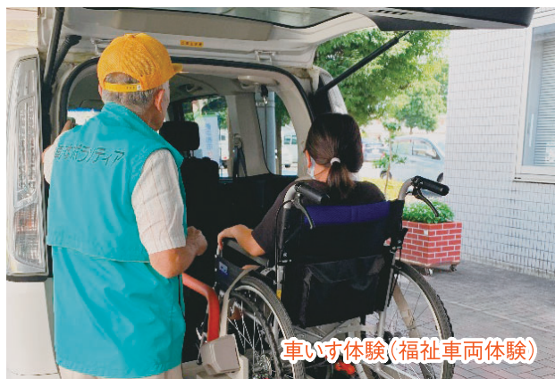
車いす体験(福祉車両体験)