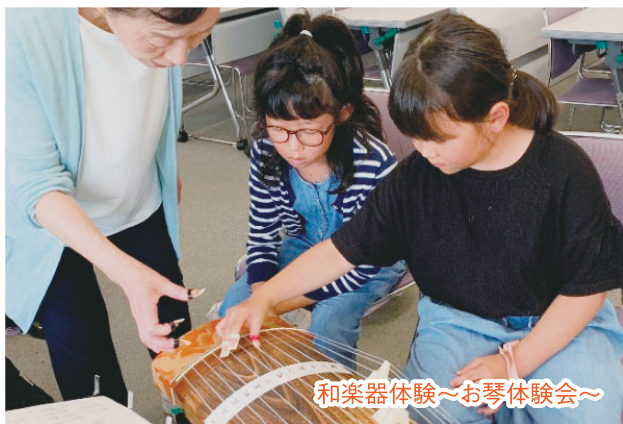
和楽器体験～お琴体験会～