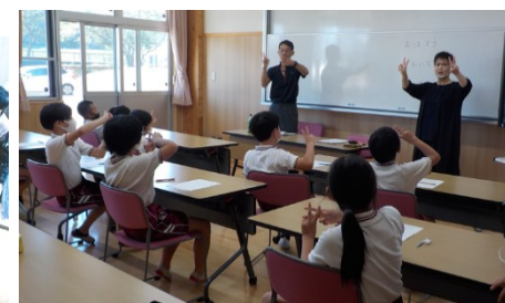
学校・地域等での福祉学習に (西在田小学校)