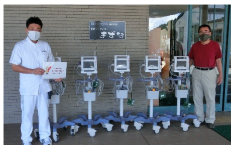
福祉施設へ (医療福祉センターきすな)