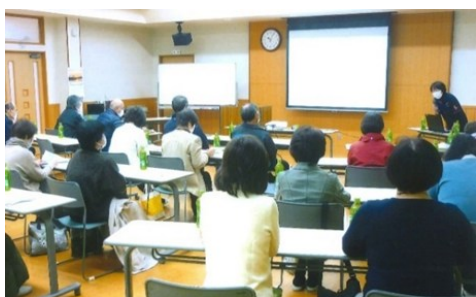
福祉委員会活動へ (富合地区)