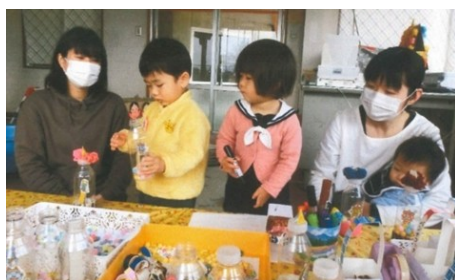
子育て支援に (桃子野子育てサロン)