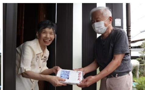
高齢者配食サービス事業へ