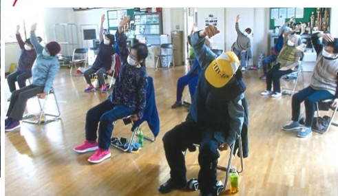
いきいきサロンへ (古坂2丁目)