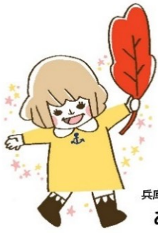
兵庫県共同募金会マスコット あかはねちゃん