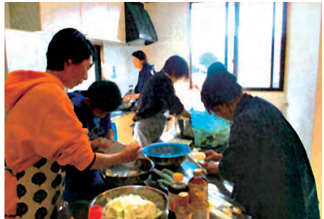
ふれあい餅つき大会～駅前町～