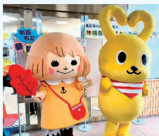
あかはねちゃん・コピー