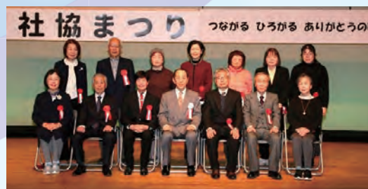
受賞された皆さま