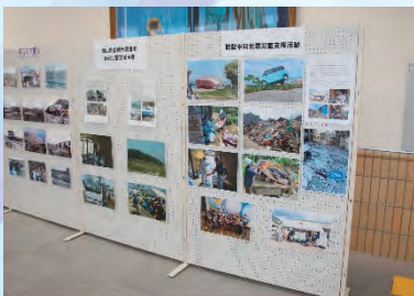
被災地支援活動パネル展示