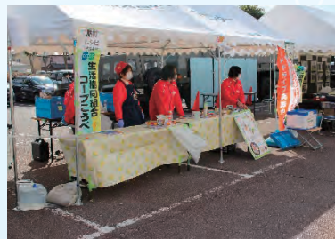
フードドライブ・防災食の試食