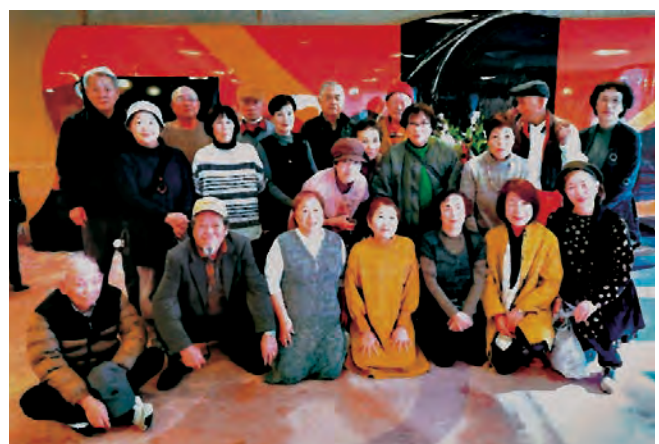
湯の花温泉日帰り旅行～上宮木町～