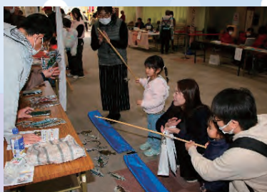
子ども食堂～ミニゲーム～