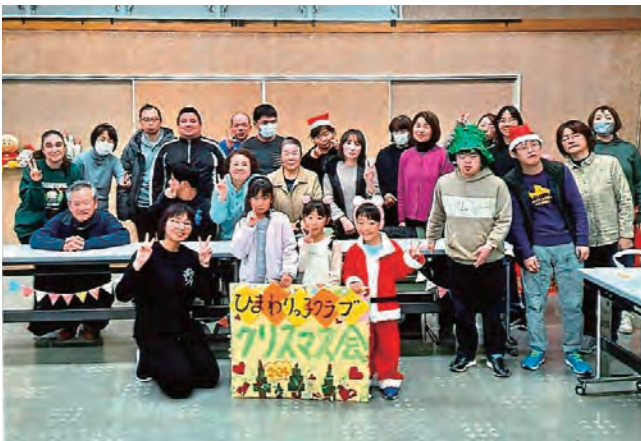
クリスマス会～ひまわりっ子クラブ～

今年度も各町、団体で地域のつながりづくりに歳末たすけあい募金配分金を活用していただいております。活動の一部をご紹介します！