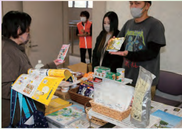
介護用品等の紹介