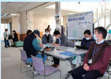
福祉相談コーナー