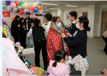
コスチューム体験