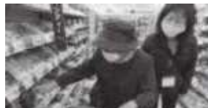
ボランティアが見守りや荷物持ちのサポート