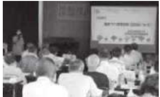
地区老人クラブでの出前講座

社会福祉協議会の職員をはじめ、それぞれの分野・専門職や地域のボランティアが講師として出向き、福祉分野の推進を行っています。