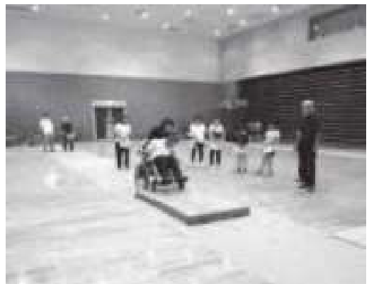
多世代交流を通じた福祉学習

車いす体験を通じて、多世代が交流しながら車いすに乗る方の気持ちを理解し、思いやりや助け合い、支え合いの心を学ぶ機会となりました。