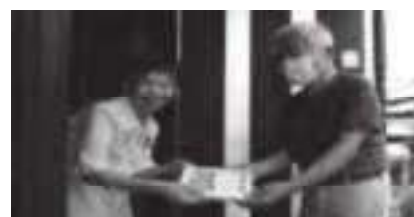
ボランティアによるお弁当配達

加西市社会福祉協議会の配食サービスは、調理・配達に協力いただいている数多くのボランティア(調理グループ14、配達グループ5)が、おられるからこそ出来る事業です。まごころのこもったお弁当を、調理が困難なひとり暮らし高齢者や、高齢者世帯などへ定期的にお届けし、同時に安否確認を行っています。配達の方は「話をすることで自分が元気をもらっています。今では、配達ボランティアが生活の一部となっています。」と話され、生きがいづくりにつながっています。