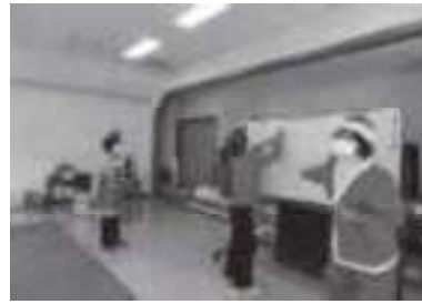
地域とのつながりが深まるサロン活動