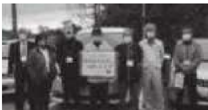
下里地区住民ボランティア結成