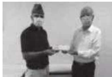
飲食店からの無料チケット提供