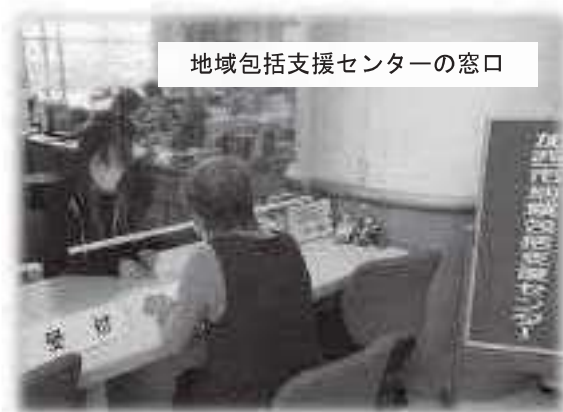
地域包括支援センターの窓口

地域包括支援センターは、高齢者が住み慣れた地域で、尊厳あるその人らしい生活を継続することができるよう、状態に応じた介護サービスや医療サービス等を提供するために、地域の高齢者の心身の健康の維持、支援を包括的に行うことを目的とした『総合相談窓口』です。保健師・社会福祉士・主任介護支援専門員・介護支援専門員等が専門性を発揮し支援を行っています。