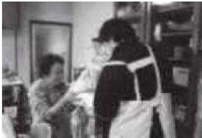
ヘルパーと一緒に片づけ