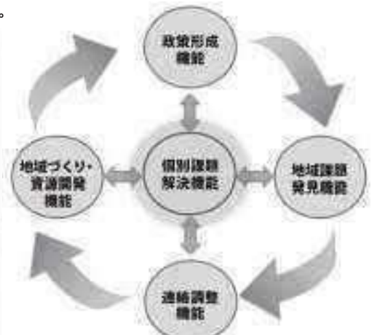
※「地域包括支援センター運営マニュアル2012」(加寿社会福祉センターP27)