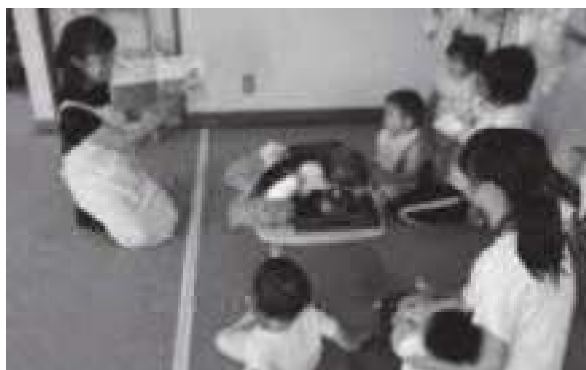
富合地区はつらつ委員会 桃子野子育てサロン

市民の皆さまから寄付いただいた共同募金は地域の福祉活動やボランティア活動等の財源として役立てられます。