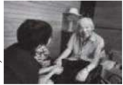
介護支援専門員の訪問

「私らしく、少しでも元気になって生活したい。」 「自分の身体が動く限り、家で介護をして一緒に暮らしたい」等 様々な願いを持たれている方の助けになるように居宅介護支援、 訪問介護、訪問入浴のサービスを提供しています。