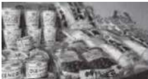
企業からの食料品提供

新型コロナウイルス感染症の影響で、生活に困窮した方を支援する取り組みとして、コープこうべさまより食料品合計402個、ムナールさまよりカレーチケット100枚の無償提供がありました。提供いただいた食料品やカレーチケットは、特例貸付の対象者で食料品等が必要な世帯を対象に配布しました。今後も生活困窮者支援の一環として企業等と連携して行っていきます。