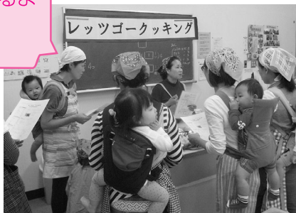
食育活動「レッツゴーキッチン」