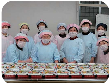
調理ボランティア「スマイル」の皆さま