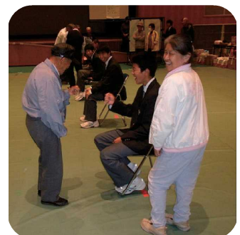
レクリエーション大会の様子

【問い合わせ先】 加西市身体障害者福祉協会 事務局：加西市社会福祉協議会内 ☎ 43 - 1281 FAX 42 - 6655