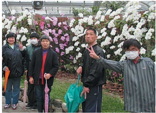
加西市立善防園 (多機能型障害福祉サービス事業所) 加西市西笠原町172-142 ☎48-3999

園での、季節感あふれる昼食も大好評ですが、桜の季節に外で食べる各家庭の手作り弁当も格別です。あちらこちらで、お弁当を開く利用者の目も輝いています。やっぱり花より団子なのでしょうか。