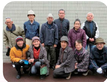
「お弁当宅配」ボランティアグループの皆さま