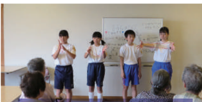
高齢者の方々にマジックを披露

今年度も、北条中学校・泉中学校・善防中学校の2年生6名が、社会福祉協議会と加西市立善防園において、ボランティア活動体験（アイマスクや車いす体験、点字教室、情報紙作り、朗読、配食サービスのお弁当づくり等）や、高齢者・障がい者との交流など、体験していただきました。