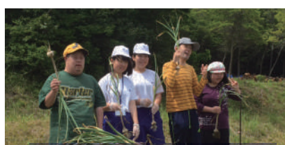
加西市立善防園での ハリマ王にんにくの収穫