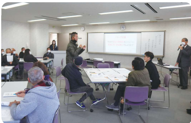
聴覚障害グループによる発表

加西市で災害が発生した際の被害想定について確認し、避難時や避難所で生活するときの課題を出し合い、今後どのように備えればいいのかを考えました。防災意識を高めるため、研修を重ねていきたいと思えます。