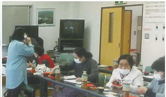
上野田町 ふれあい人形・干支づくり