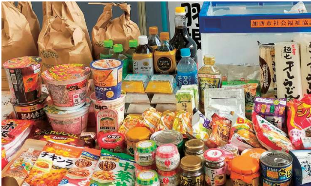
提供いただいた食料品

市内の企業や市民の方々から大変多くの食料品が集まり、必要とされている方へお届けしました。今後も取り組みを継続していきますので、引き続きあたたかいご支援をよろしくお願いいたします。