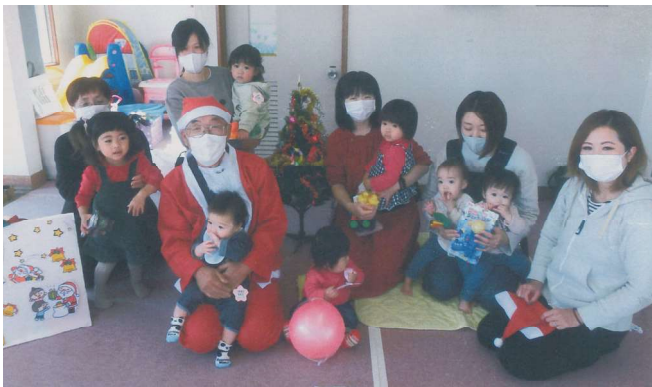
富合地区桃子野子育てサロン クリスマス会