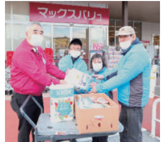
食料品等の贈呈式(善防園利用者受取)

提供いただいた食料品等は、加西市と協力しながら生活困窮者や子ども食堂へ配布する予定です。