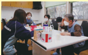
社協職員との話し合い

地域を歩いて住民の声を拾い上げ、区長さんや戸主会、シニアクラブと情報共有をしながら進めてきました。