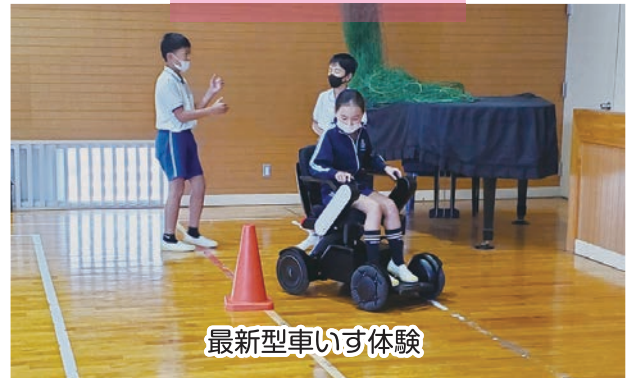
最新型車いす体験