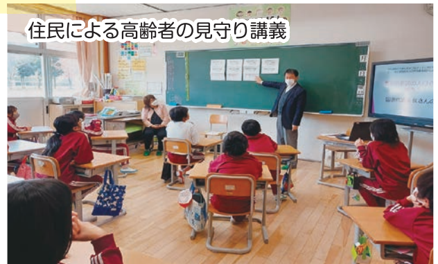
住民による高齢者の見守り講義