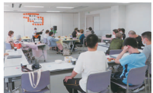
きずなカフェの様子