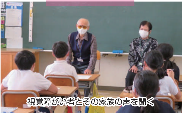
視覚障がい者とその家族の声を聞く