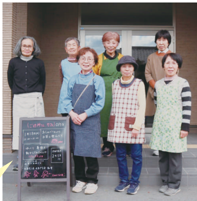
じゃがいもの会* (スタッフ) の皆さん ※どんな料理にでも馴染むじゃがいもにちなんで命名