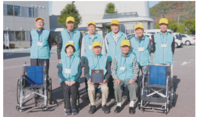
体験指導(車いす)ボランティアグループ