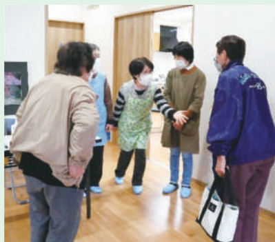
カフェ終了 参加者の見送り