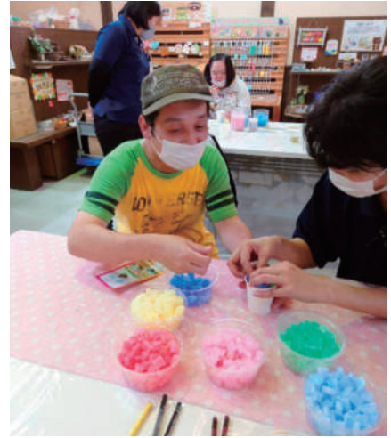
▲キャンドル作り体験