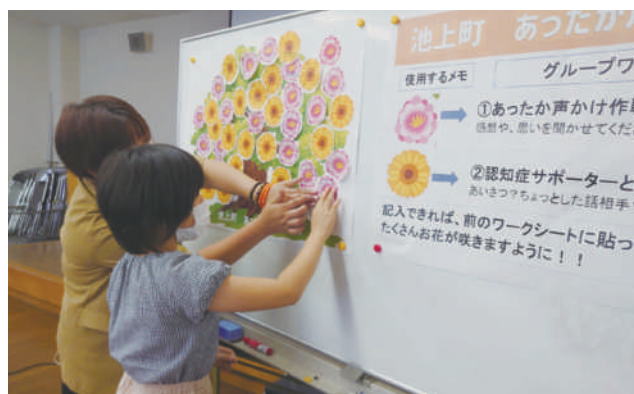
▲池上町 グループワーク