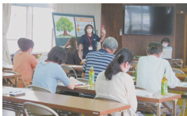
▲青野町 認知症地域支援推進員からの説明