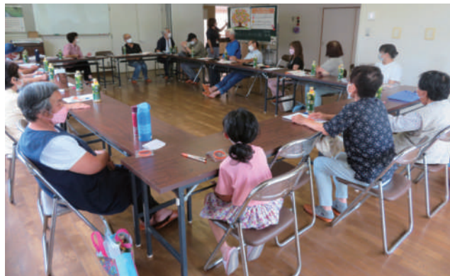
▲大柳町 認知症サポーター養成講座