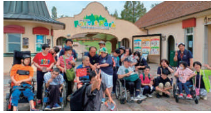
▲ドイツの森で記念撮影