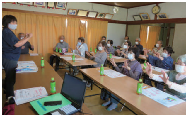
▲中西北町 講座の合間にアイスブレイク