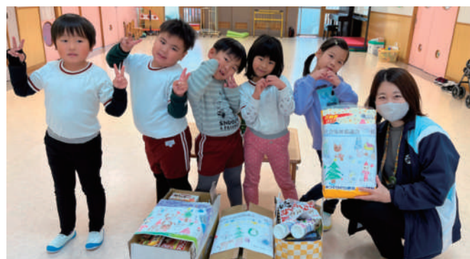
認定白竜こども園

市内の企業やこども園・市民の方々から食料品約1,300点と米146kgが集まり、生活にお困りの方に配布しました。今後も取り組みを継続していきますので、引き続きあたたかいご支援をよろしくをお願いします。