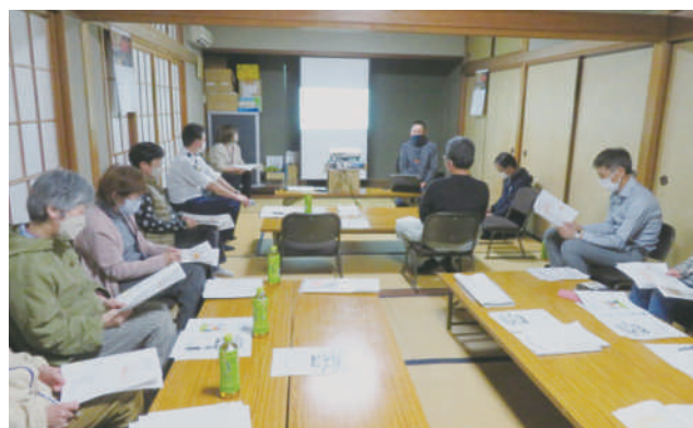
▲北町 認知症サポーター養成講座