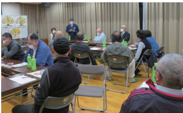
▲窪田町・吸谷町 駐在さんからの助言