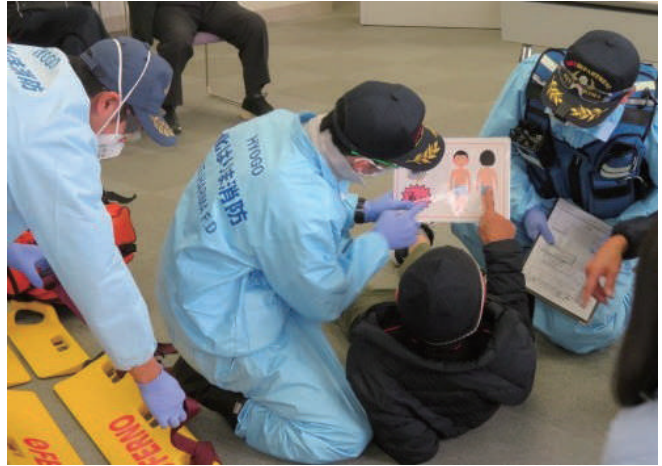
コミュニケーションボードを使った対応