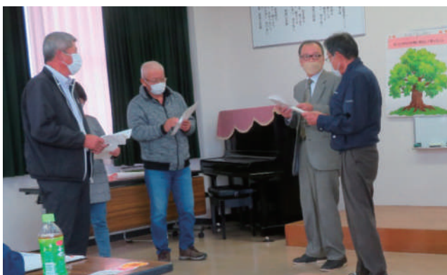
▲九会地区 住民による寸劇