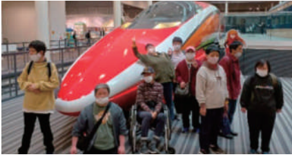
▲期間限定車輛と記念撮影

今年も4グループに分かれて、「京都鉄道博物館」・「八つ橋庵とししゅうやかた」、「岡山フォレストパークドイツの森」へ行って来ました。