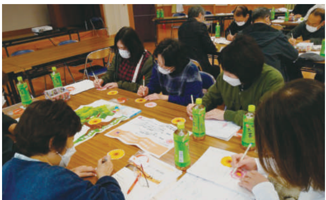
▲下若井町 グループワーク