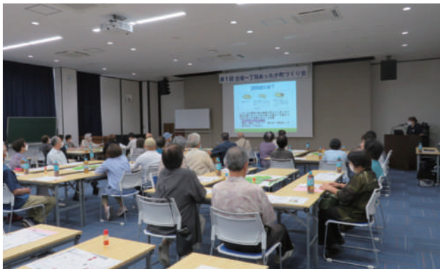
▲古坂1丁目 認知症サポーター養成講座