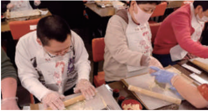
▲京和菓子 生八つ橋作り体験