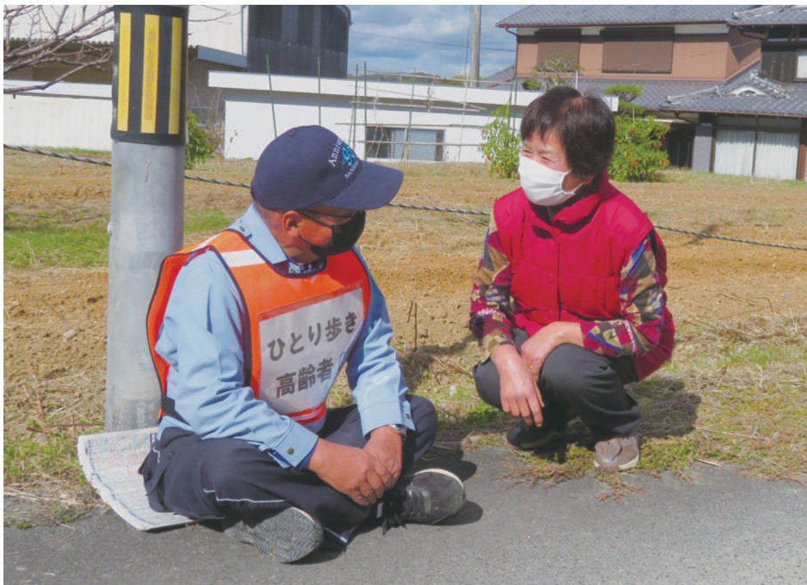
▲常吉町 住民による声かけ訓練