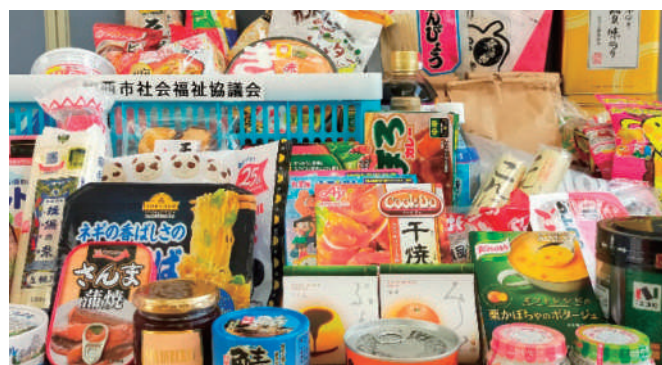
提供いただいた食料品